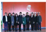
PBL 教学团队赴上海观摩学习

山东中医药大学 PBL 教学团队打破单一学科和课程界限, 吸纳、选拔各课程教学和教研能力突出、热心教学改革、创新能力强、对 PBL 教学有研究基础的骨干教师作为团队的核心成员, 着力打造一支梯队结构合理、团队规模稳定、业务能力强的教学团队。在团队共同建设目标的指引下, 每位成员都具有实现共同目标必需的知识与技能, 且成员之间在知识技能上具有较强的互补性, 能相互取长补短, 共同提高。在团队建设过程中, 逐步形成了“积极向上、不断进取、学习型”的团队文化, 教师们能够静下心来, 养成严谨的教学作风, 以高度的责任感、事业心参与教学改革; 教师之间, 发扬团队协作、互助学习精神, 有畅通的交流渠道, 能够相互促进, 共同提高, 从而实现群策群力、合作共赢的目标。