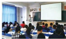
《中医诊断学》分组讨论汇报