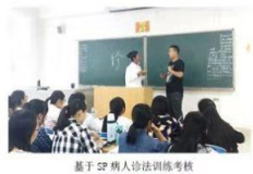
基于 SP 病人诊法训练考核